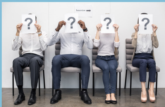
Servizi per il lavoro