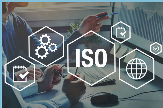
Consulenze e certificazioni

Il centro inoltre ha avviato negli anni attività di consulenza, per aziende e per privati, in diversi ambiti di attività, rispondendo così alle esigenze sempre più specifiche del mercato, ponendosi quindi l'obiettivo di progettare, in continua innovazione, l'architettura ed i contenuti dell'azione formativa. Fondazione Simonini è accreditato per l'attivazione di tirocini formativi e apprendistato professionalizzante . Dal 2016 è accreditato per la formazione continua e permanente anche in regione Friuli Venezia Giulia.